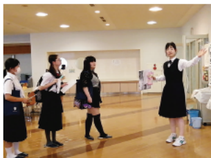
オープンスクール