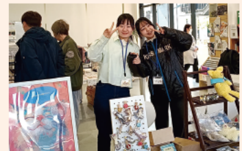
保護猫ボランティア